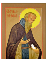
Преподобный Симеон Новый Богослов:

Если увидим или услышим, что кто-нибудь в продолжение немногих лет приобрел высочайшее бесстрашие, верь, что такой шествовал не иным путем, но блаженным смирением.