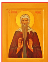
Преподобный Исаак Сирийниневийский:

Страсти телесные ведут начало свое от естественных потребностей плоти – и против них нужно воздержание; а страсти душевные порождаются от потребностей душевных – и против них нужна молитва.