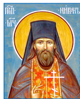
Преподобный Никон Оптинский (Беляев):

Страсти не могут нами господствовать, когда мы сопротивляемся им и призываем на них помощь Божию. Укрепляет же в нас страсти и подает им над нами победу наше самолюбие и гордость. Против этого наиболее должна ты вооружиться и сопротивляться им, тогда и другие удобно побеждены быть могут. Когда же мы падаем какой-нибудь страстью, то явно предварила этому падению гордость, по слову святого Лествичника. Потому надо всего больше поучаться смирению.