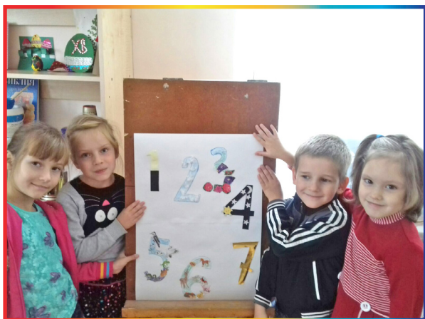
Работа младшей группы «Семь дней сотворения Мира»