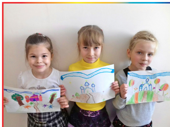
Рисунки ребят к празднику Покрова Пресвятой Богородицы