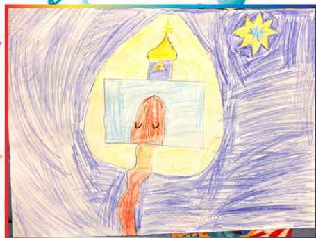
Настя Саенко, 8 лет. Рождественская ночь