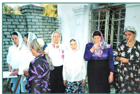
Наши первые прихожанки

Наши прихожане, те, что были первыми и уже отошли ко Господу, все в основном таки-