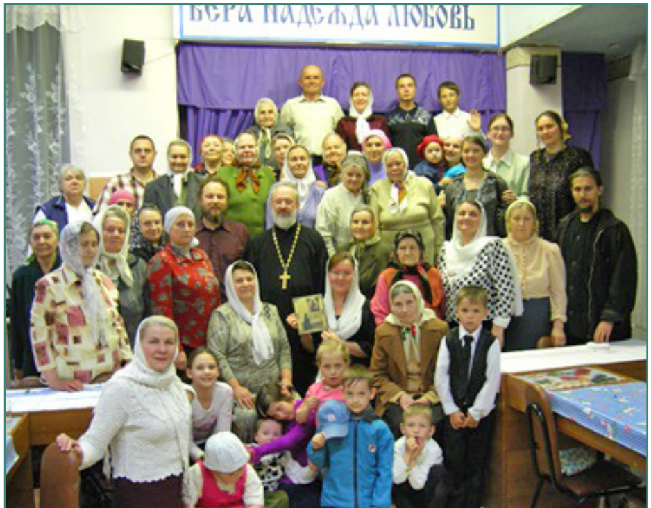
14.05.2007 г. Престольный праздник

Наш батюшка, наш учитель, наш духовный отец. Он всегда с нами.