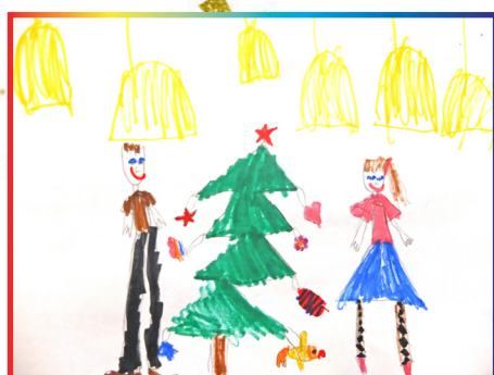
Ксюша Саенко, 6 лет. Как мы наряжали ёлку