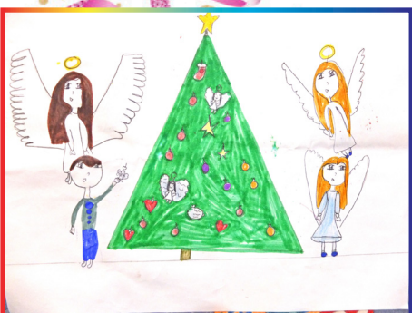
Соня Кошечкина, 8 лет. Подготовка к Рождеству