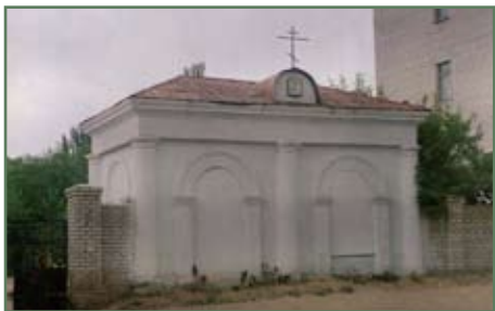
Так выглядело здание, где 20 лет назад начались первые службы.